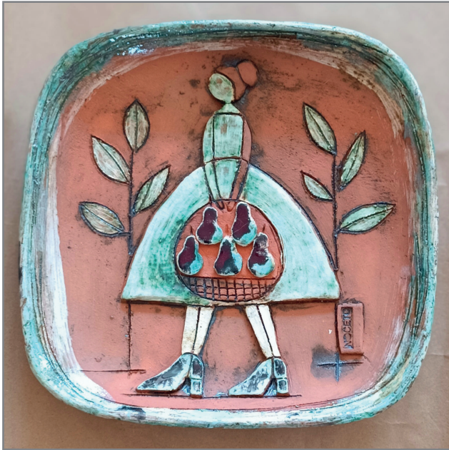
Terracotta ingobbata con ossidi e smalti