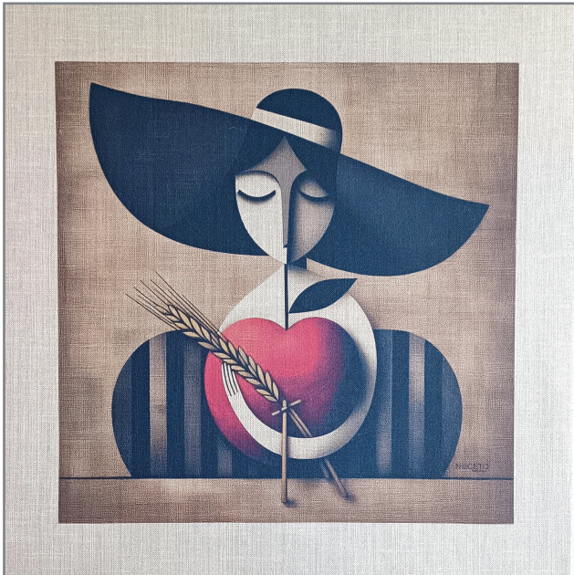
Grafica su tela grezza e talaio in legno